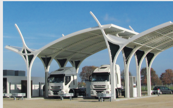
LNG-Tankstelle für Lkws