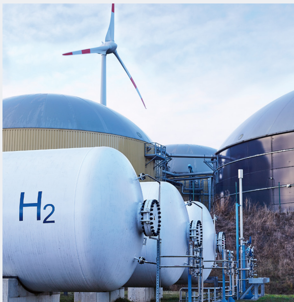
Außenansicht eines Hybridkraftwerks