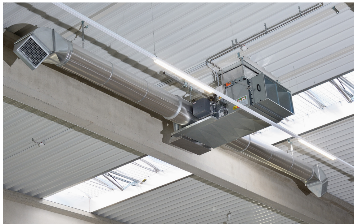
Warmluftheizer mit Außenluftanschluss über Dach und Raumlufteinlass für Um-, Misch- und Außenluftbetrieb (Foto: LK-Metallwaren GmbH)

Da die Warmluftheizung die Luft der Halle ohnehin ansaugt und somit für eine Luftzirkulation sorgt, lässt sie sich sehr gut mit einer Lüftungsanlage kombinieren. In diesem Fall leitet die Anlage die aus dem Raum entnommene Luft ins Freie ab und führt Frischluft von außen zu. Die Frischluft wird durch den beheizten Wärmeübertrager aufgeheizt. Damit hierbei nicht unnötig viel Energie verbraucht wird, ist Wärmerückgewinnung wichtig. Die Abluft wird dazu über einen zweiten Wärmetauscher geführt und wärmt die kalte Frischluft vor. Dank der Restwärme aus der Abluft kann die Frischluft selbst bei frostigen Außentemperaturen auf eine Temperatur von 15 Grad Celsius vorgewärmt werden. Sie muss demzufolge von der Warmluftheizung weniger stark aufgeheizt werden.